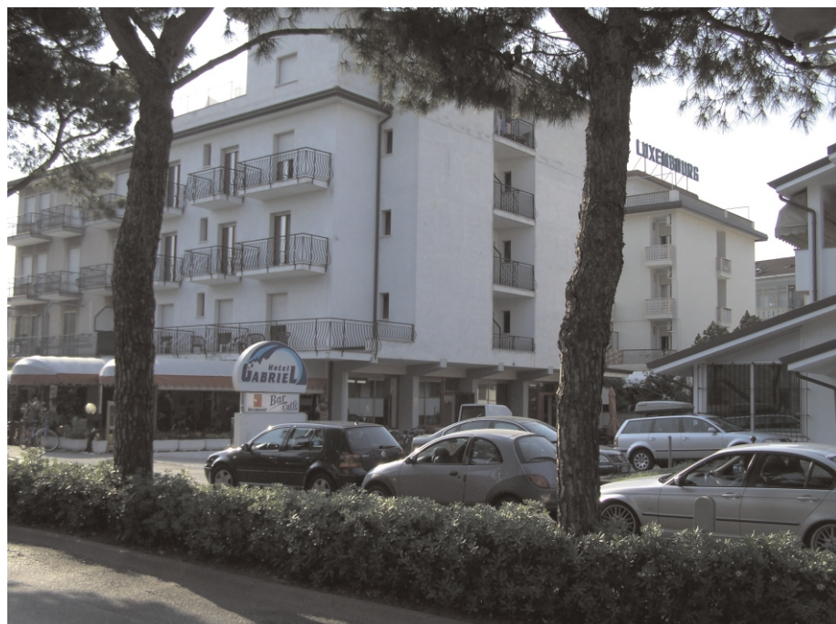
Krásné dva týdny jsme strávily na praxi v hotelu Gabriel v italském Caorle.