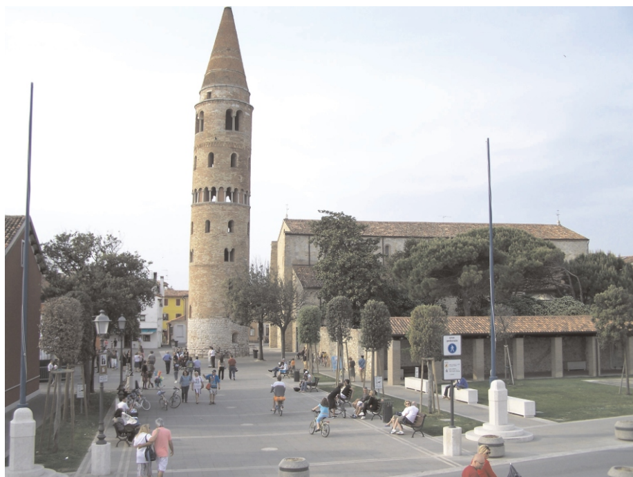
Caorle má své historické centrum s romantickými klikatými uličkami a turistický přístav. Málakdo ví, že klikaté uličky v centru Caorle bývaly ještě před několika sty lety vodní kanály, které byly později zasypany. Caorle vlastně kdysi bylo jako malé Benátky!

V hotelu Gabriel jsme se přivítaly s děvčaty, která jsme přijely vystřídat, a samozřejmě jsme byly zvědavé, jak bude vše probíhat. Na dlouhé rozhovory ale moc času nebylo. Začaly jsme přejímkou baru a veškerého zboží, přípravou na večere a samozřejmě servisem večerí. Druhý den jsme vstávaly již před sedmou a šly prostírat na snídaně, které se podávaly formou nabídkového stolu, takže to byla pro nás výhoda. Hosté se sami obsluhovali a my jsme jen doplňovaly