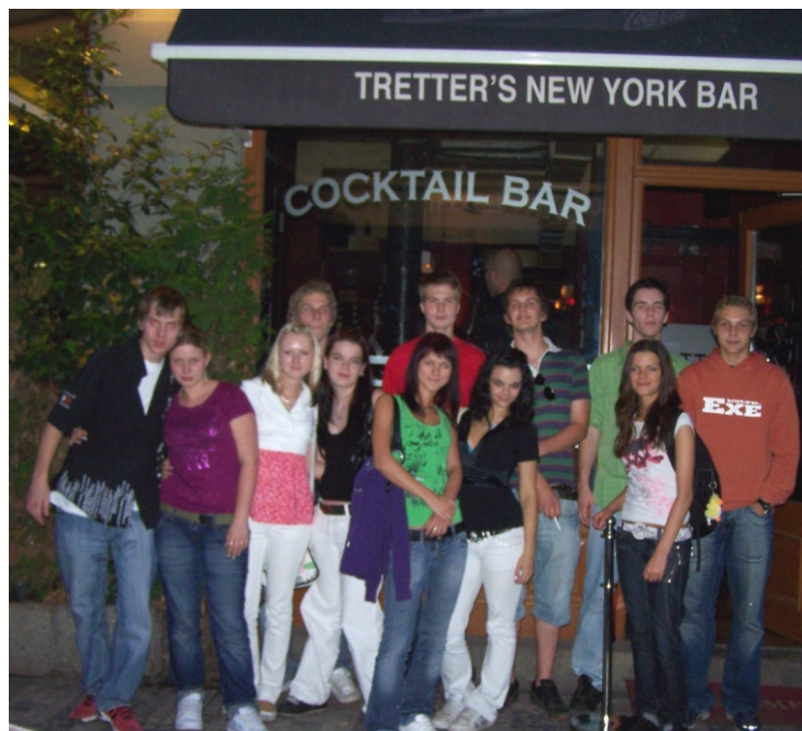
Tretter's bar to je stylová hudba, dobové fotografie a interiér ponořený do hluboké bordó barvy. Vše dohromady evokuje náladu a atmosféru Paříže a New Yorku třicátých let minulého století.

Chvějící se ruce, nervozita, abychom nezapomněli složení jednotlivých nápojů, konverzace se zkušební komisí s vypětím všech